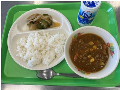
学校給食 カレーの日