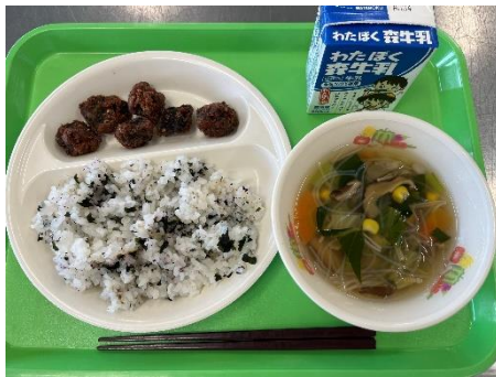
くじらのたつたあげ