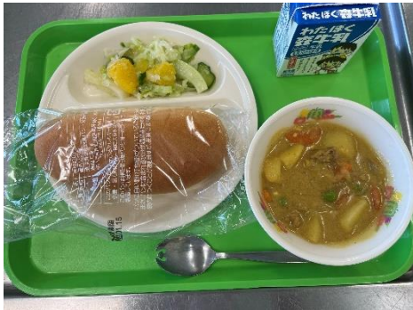
コッペパン・カレーシチュー