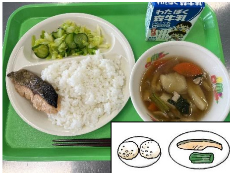
日本初の給食メニュー