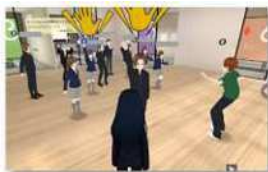
【3Dメタバースでの交流の様子】