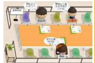
【メタバースを活用して専門職に悩みを相談したり、進路について相談したりする様子】